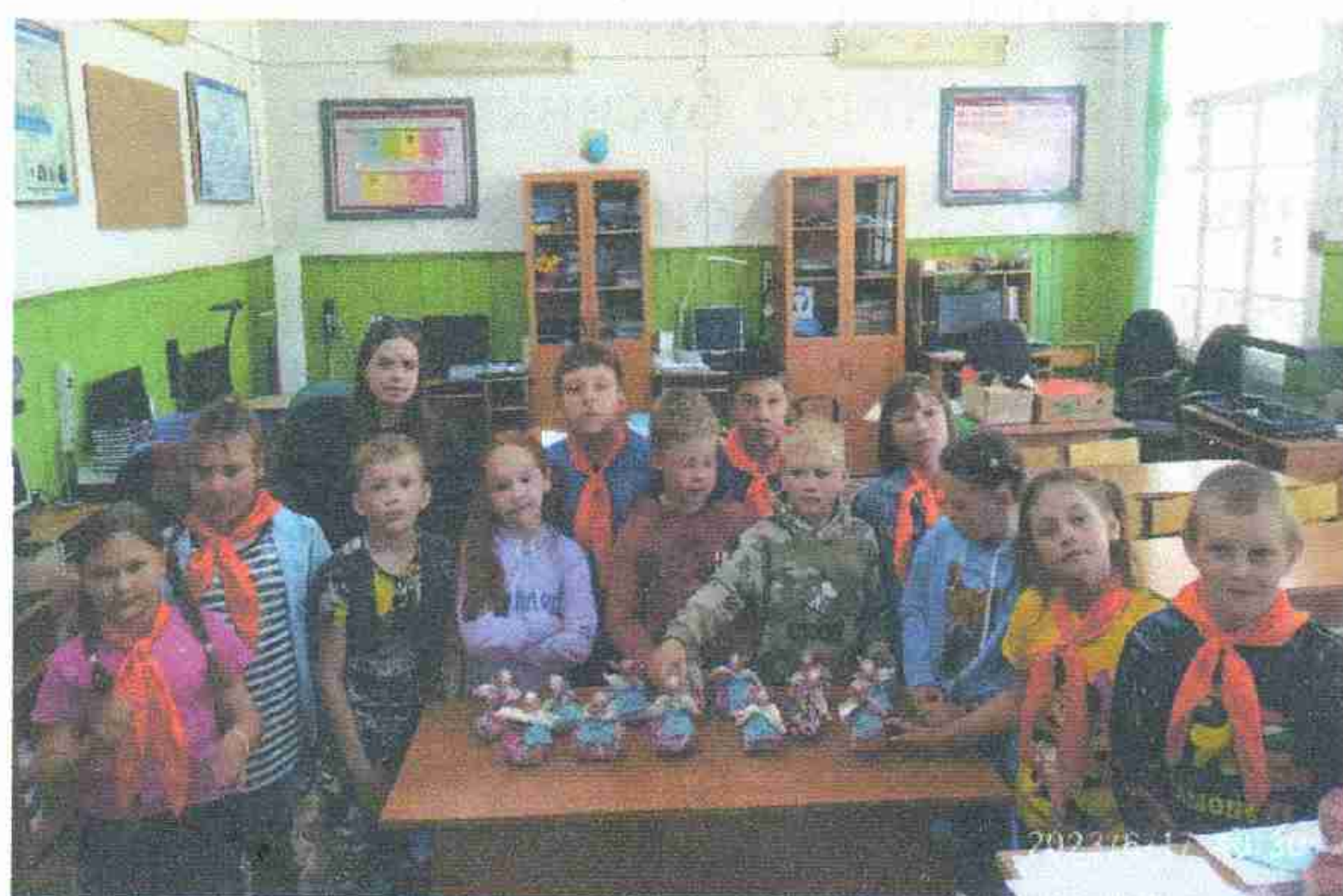
На занятиях по программе «Календарь народной куклы» в Тавреньгской СШ